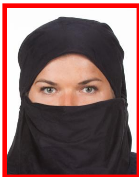
osoba z nakryciem głowy i twarzy