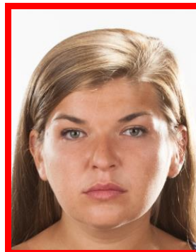
prześwieceni od tła