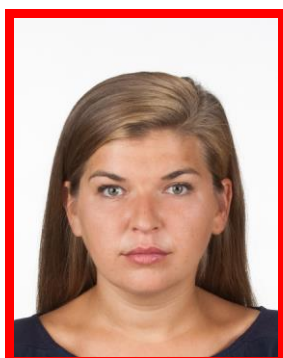
zbyt mała twarz