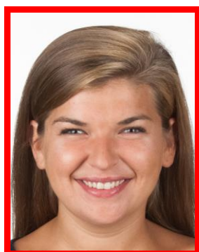
nienaturalny wyraz twarzy