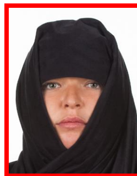
osoba z nakryciem głowy i twarzy