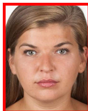
zbyt duża twarz