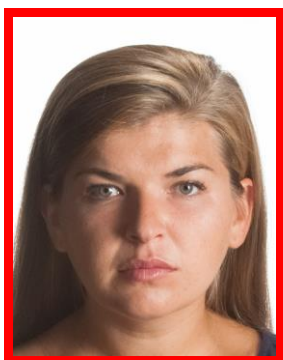
nierównomierne oświetlenie twarzy

Twarz musi być oświetlona równomiernie. Niedopuszczalne są refleksy (odbicia światła na skórze czy włosach powodujące białe plamy w tych miejscach) oraz cienie na twarzy.