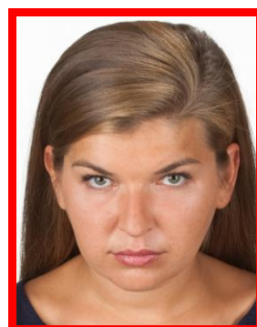
tw. ptasia perspektywa