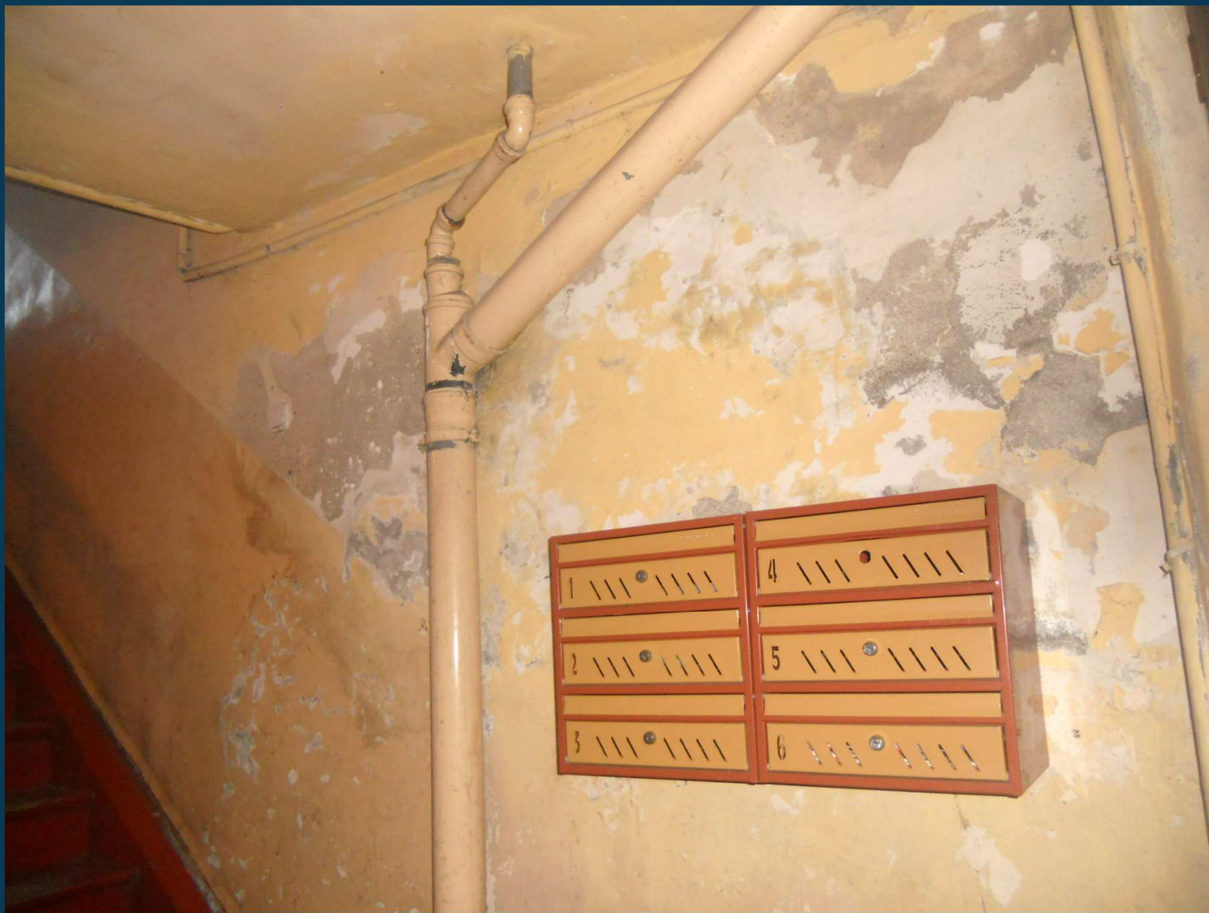
Rybaki 5 – klatka schodowa przed remontem