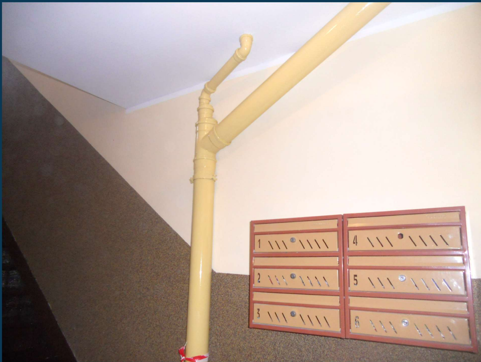
Rybaki 5 – klatka schodowa po remoncie