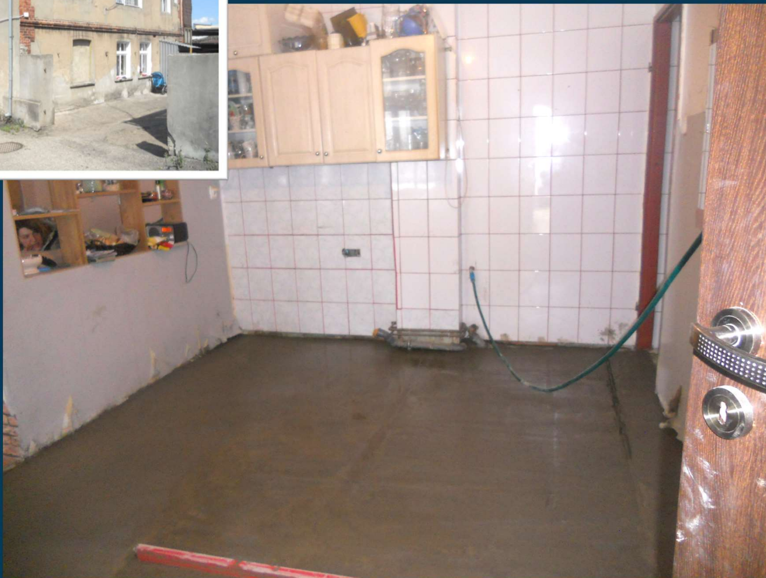
Wroniecka 7/3 –wymiana drewnianej podłogi na betonową wraz z dociepleniem styropianem gr 5 cm.