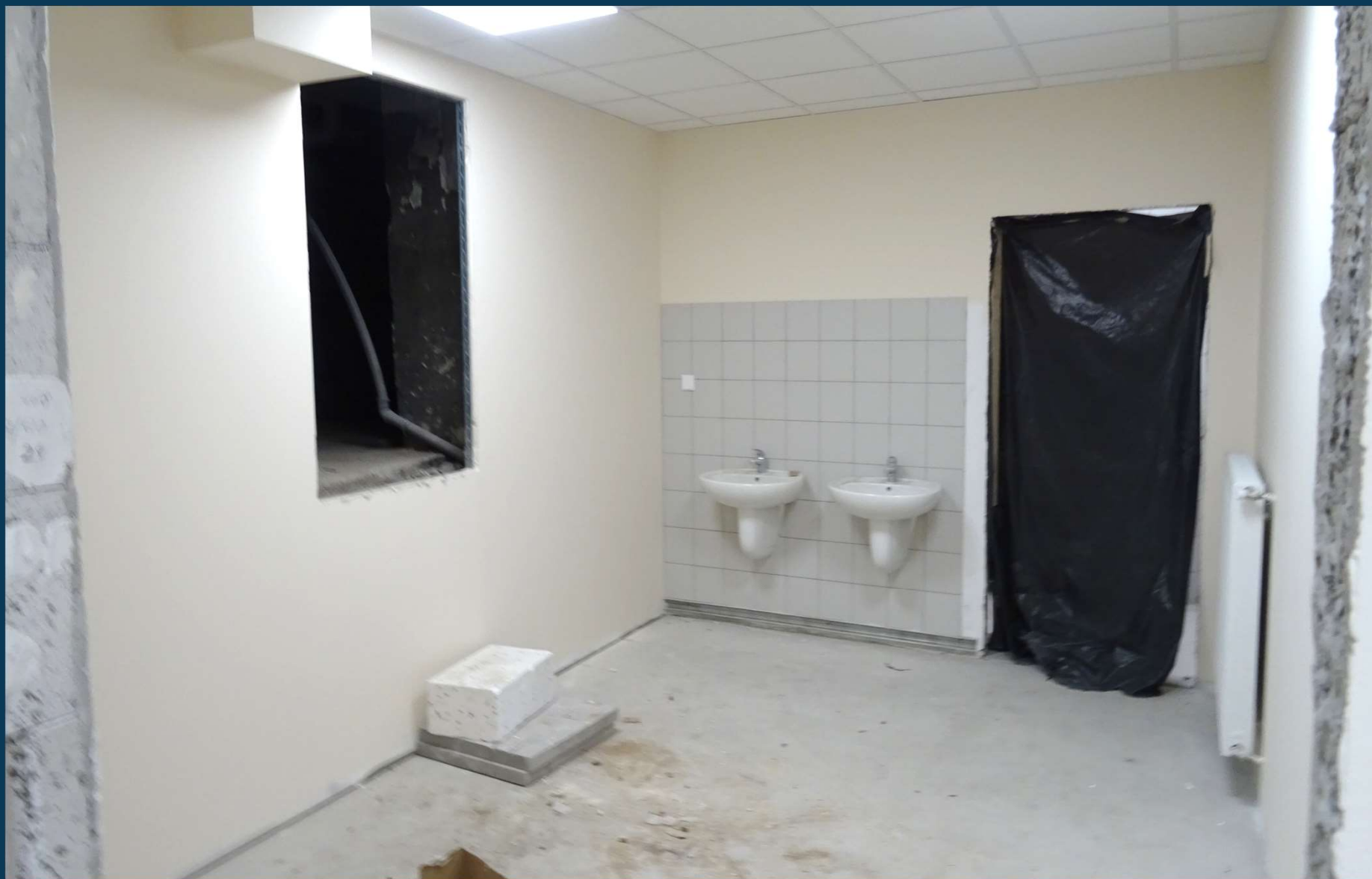
Rozbudowa budynku publicznego Szkoły Podstawowej nr 2.