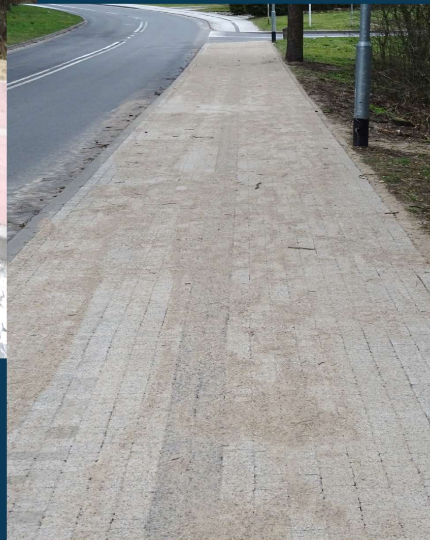
Remonty cząstkowe nawierzchni z kostki chodników i ulic w Czarnkowie