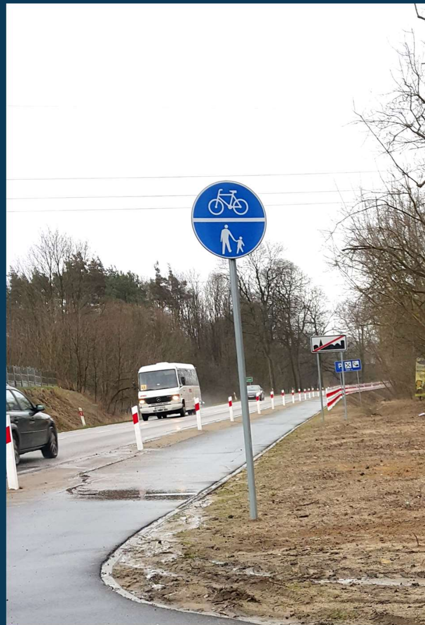
Wykonano dodatkowe oznakowanie ze słupków U-1a przy ścieżce rowerowej wzdłuż ulicy Poznańskiej.