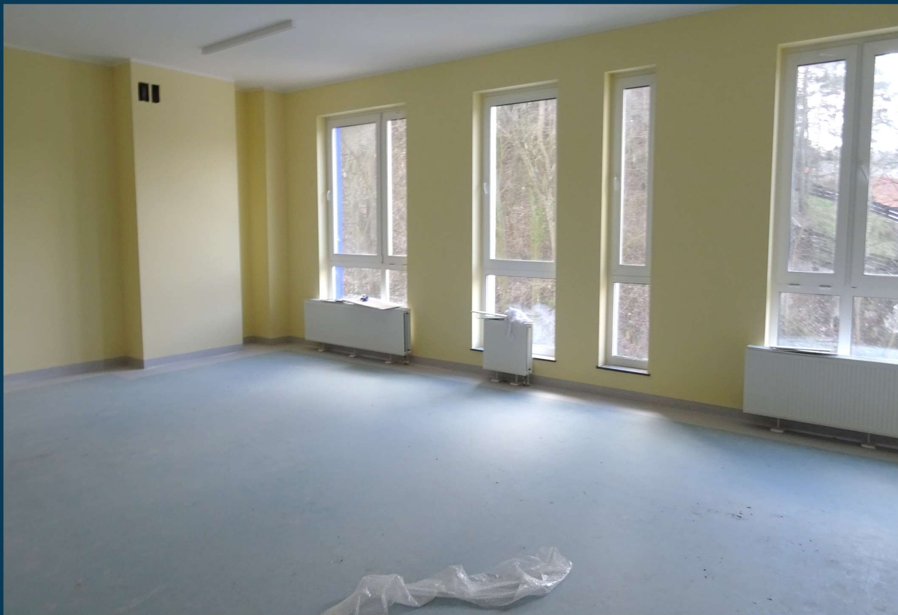
Rozbudowa budynku publicznego Szkoły Podstawowej nr 2.