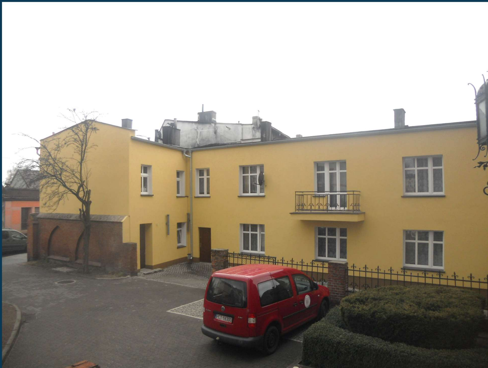
Rybaki 5 – po remoncie