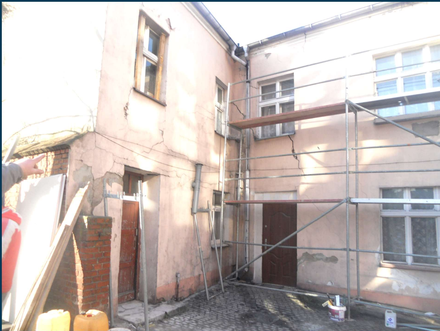
Rybaki 5 – w czasie remontu