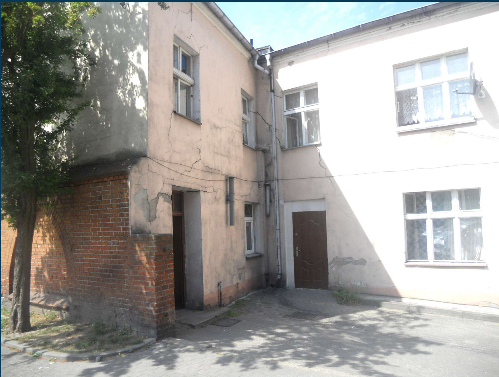
Rybaki 5 – przed remontem