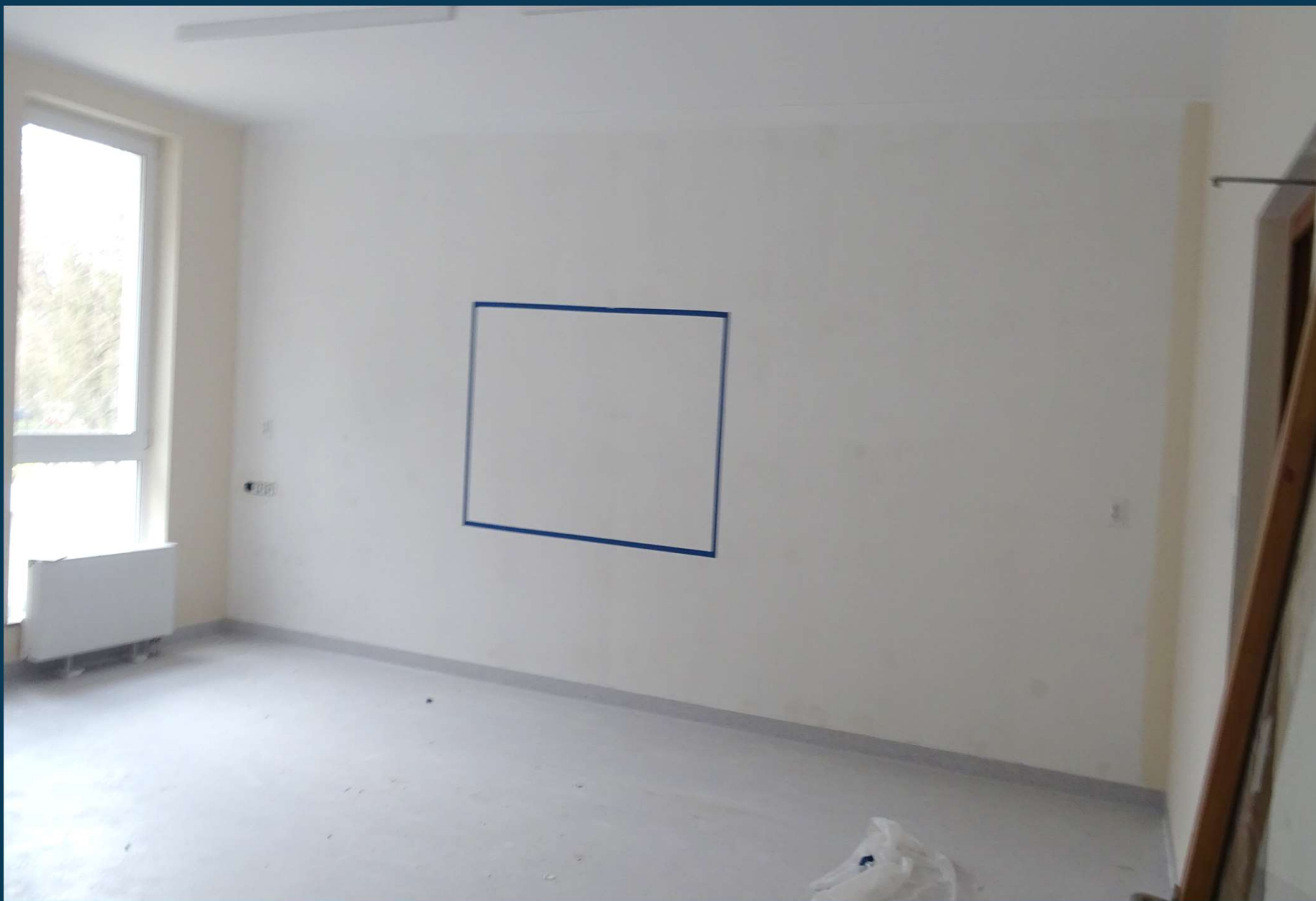
Rozbudowa budynku publicznego Szkoły Podstawowej nr 2.