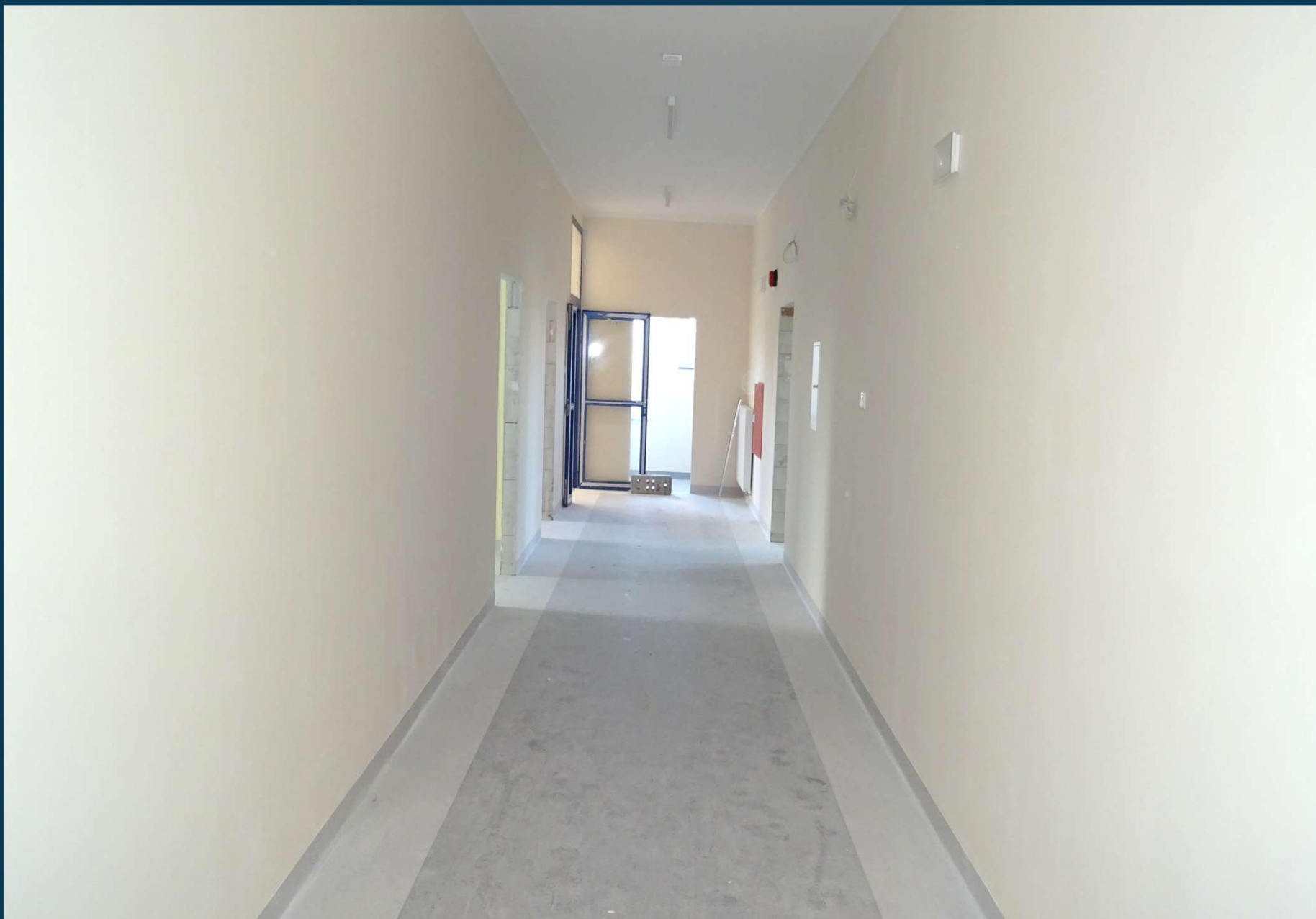
Rozbudowa budynku publicznego Szkoły Podstawowej nr 2.