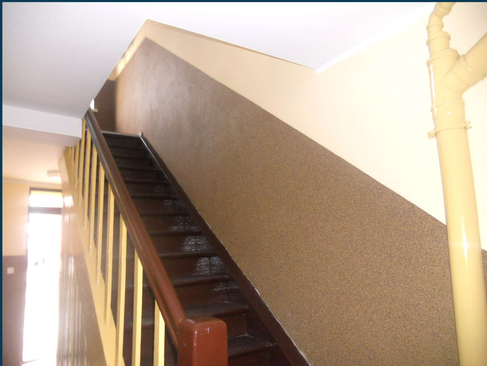
Rybaki 5 – klatka schodowa po remoncie