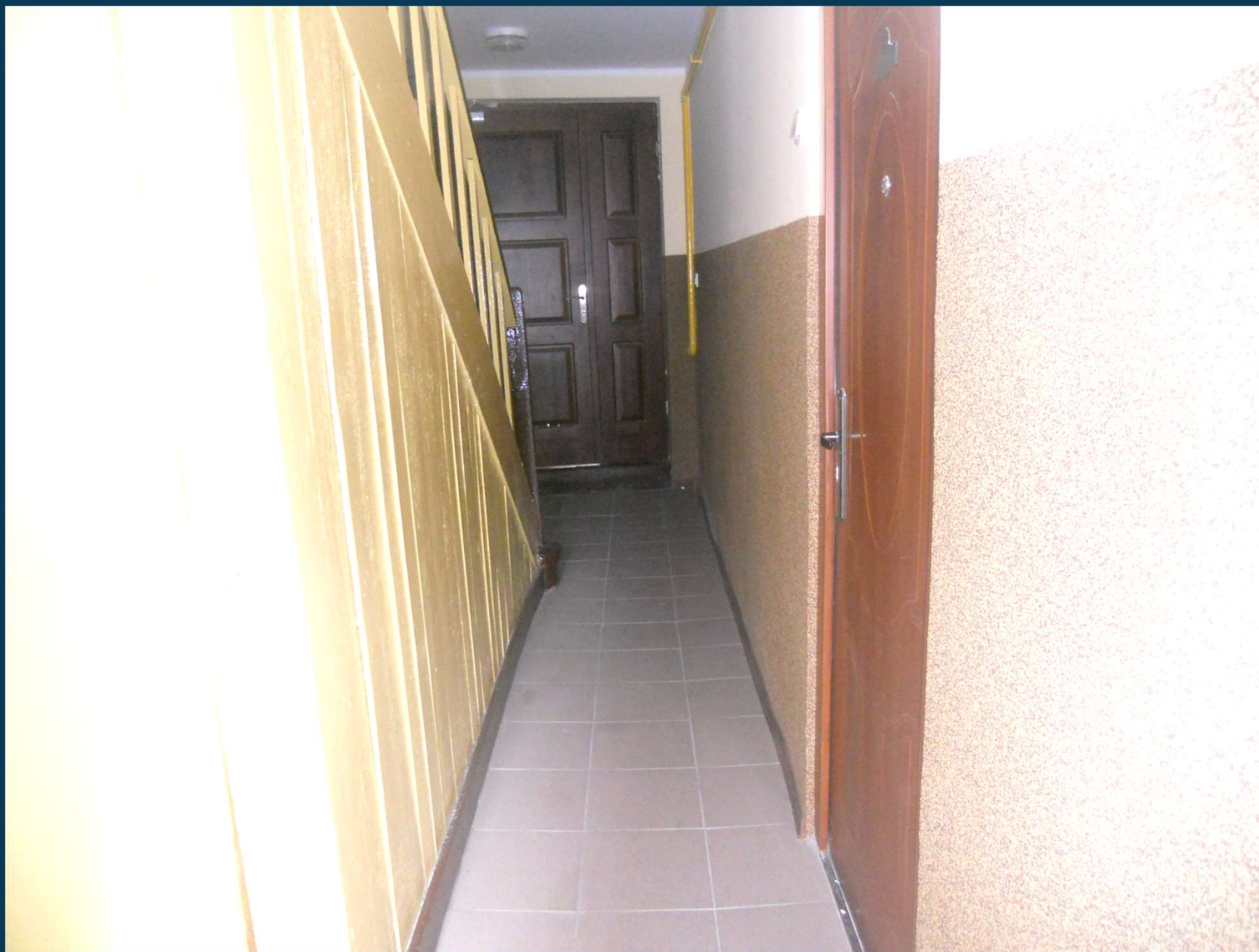
Rybaki 5 – klatka schodowa po remoncie