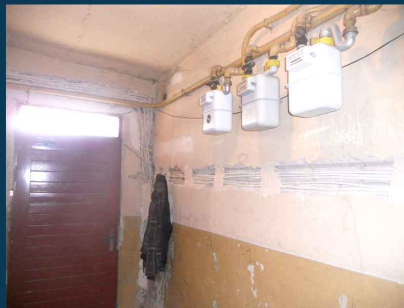
Pl. Wolności 17 – na klatce schodowej wymieniono instalację elektryczną z tablicami elektrycznymi i zabezpieczeniami na typu S.