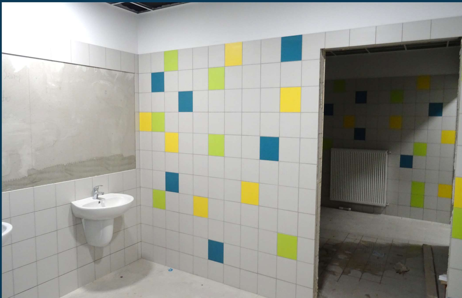
Rozbudowa budynku publicznego Szkoły Podstawowej nr 2.