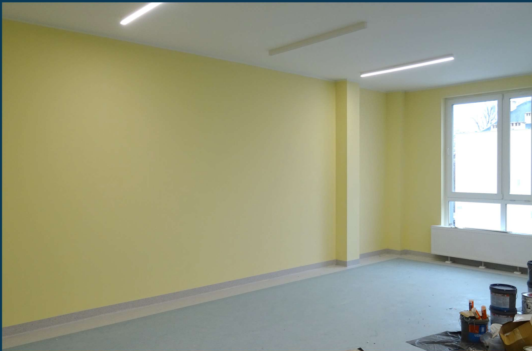
Rozbudowa budynku publicznego Szkoły Podstawowej nr 2.