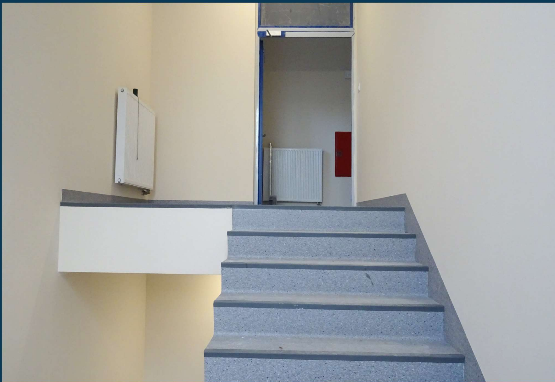
Rozbudowa budynku publicznego Szkoły Podstawowej nr 2.