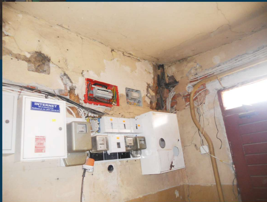
Pl. Wolności 17 – na klatce schodowej wymieniono instalację elektryczną z tablicami elektrycznymi i zabezpieczeniami na typu S.