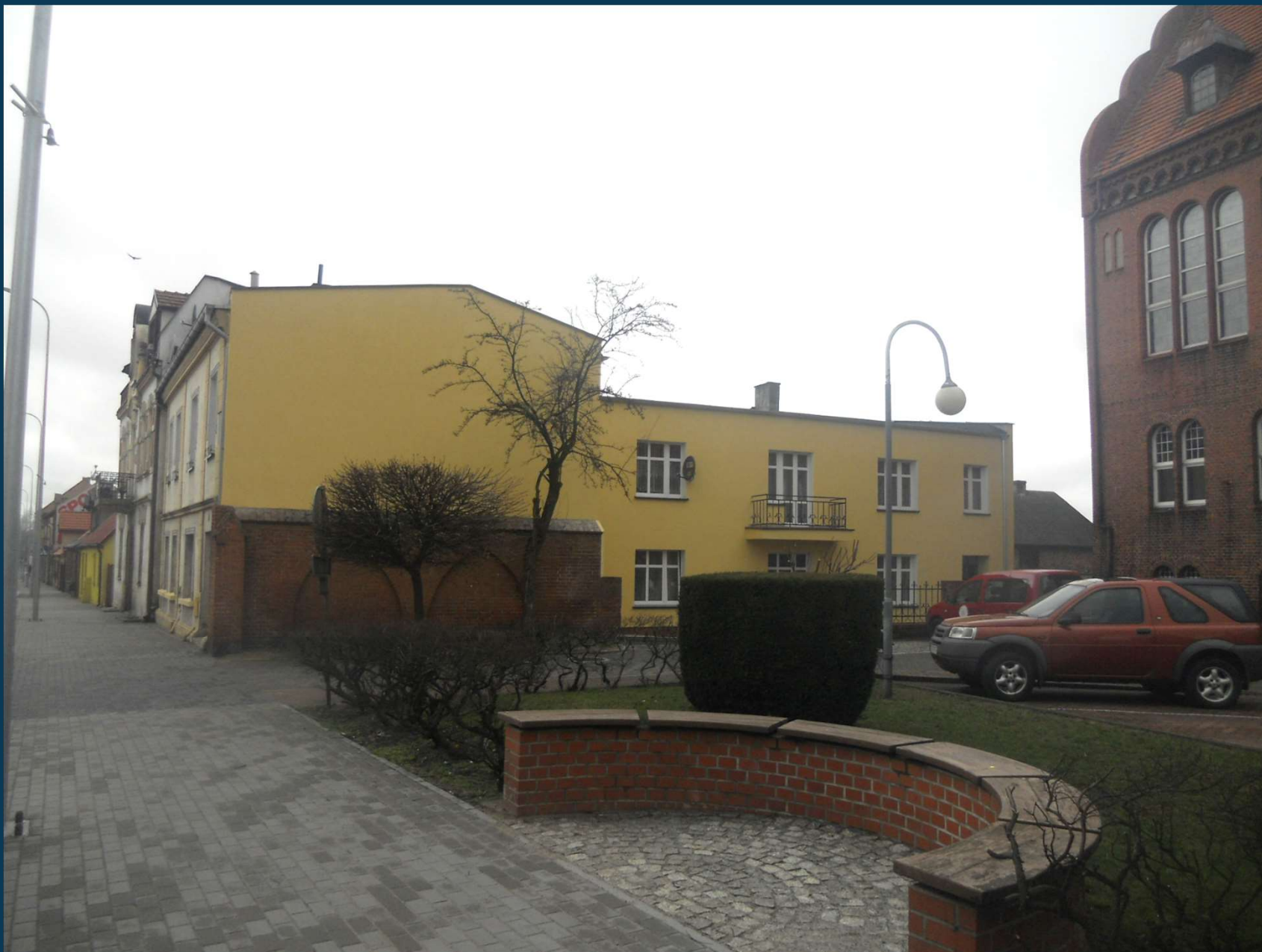
Rybaki 5 – po remoncie